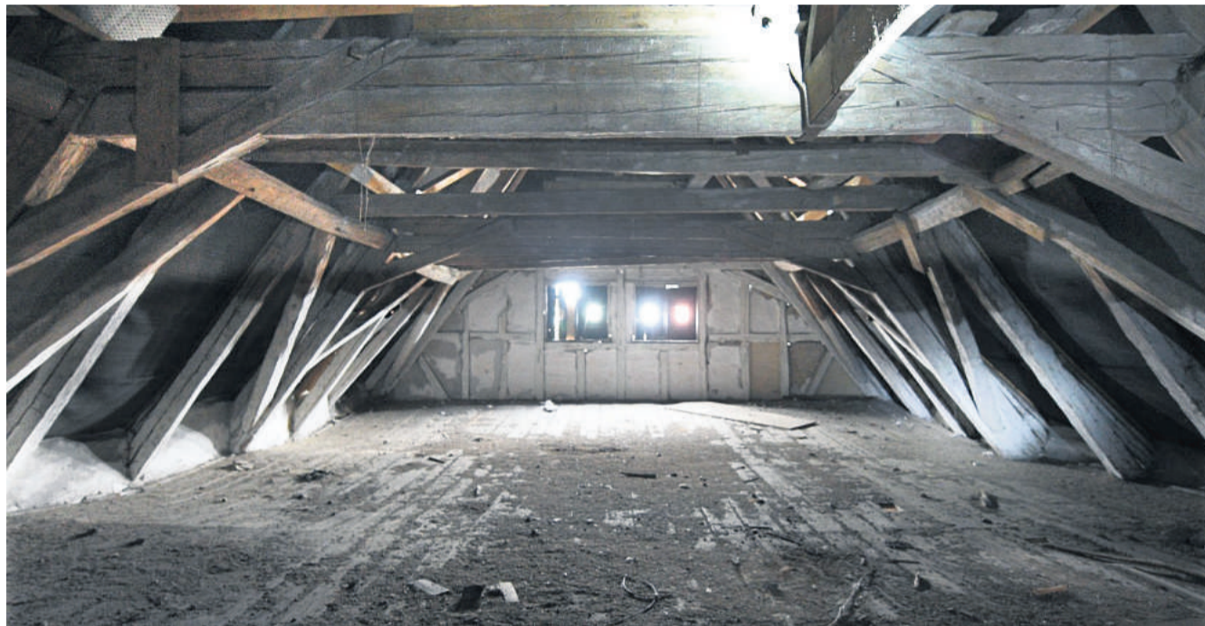
Dronningens Pakhus blev bygget, da Lolland var et af de rigeste områder i Danmark, og det gamle tømmer fra 1589 virker fortsat sundt. Nogle steder er det kalket.

Det var den entreprenante enkedronning Sophie, Christian IV's mor, der lod byg-