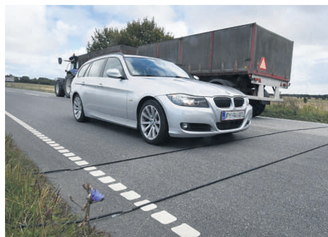
Her er det på Maribovej ved Halsted ved indkørslen til Rute 9, at der er lagt kabler ud.